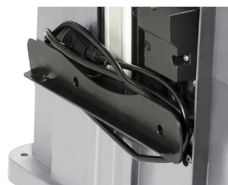
Enrouleur de câble Cable storage

Livrée avec guide parallèle, guide d'angle, poussoir et clef de serrage Delivered with parallel guide, angle guide, pushing bar and tightening wrench