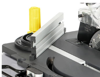
Guide d'angle Angle guide